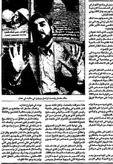
عنان بن دويك، اغتيل

قهر المحزونين في قطاع غزة، حيث قال إن محاولة اغتياله عززت حماس، وفتحوا العديد من المحلات التجارية، وفتحوا العديد من المطاعم والفنادق. وقال مدير الكازينو: "الكازينو ليس فقط مكان للترفيه، بل هو مكان للحياة، حيث بدأنا نرى حياة تعود الى اريحا، ونرى الناس يبتعدون عن المخيم ويتوجهون الى اريحا للترفيه والعمل".